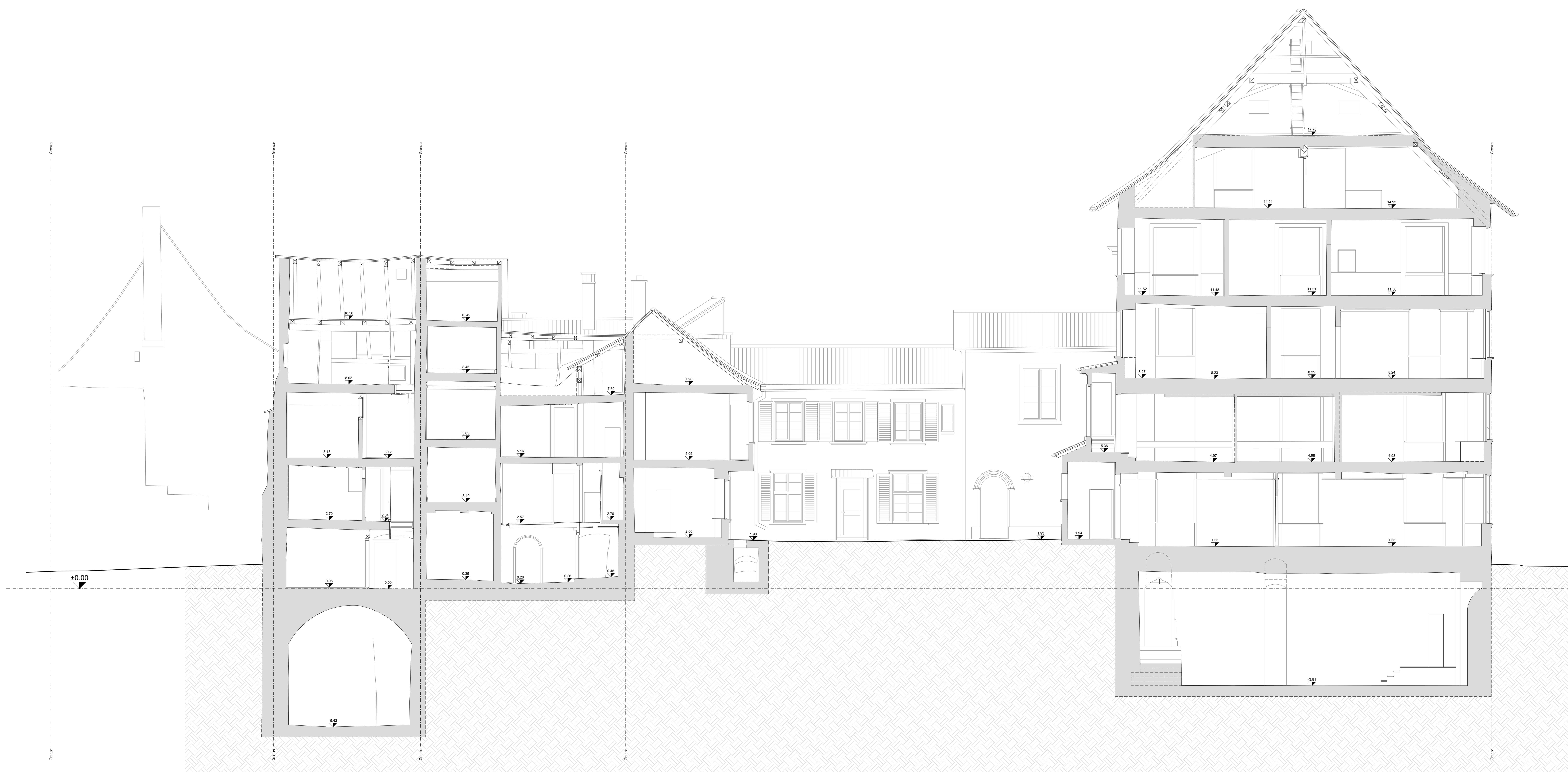
Schnitt 9-9 M 1:50